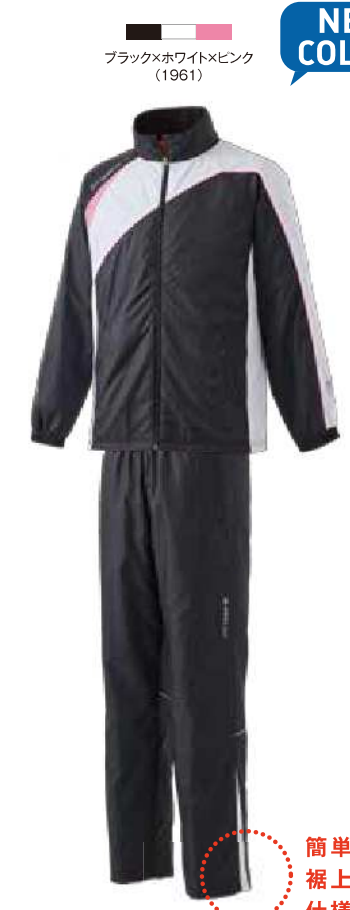
ブラック×ホワイト×ピンク (1961)