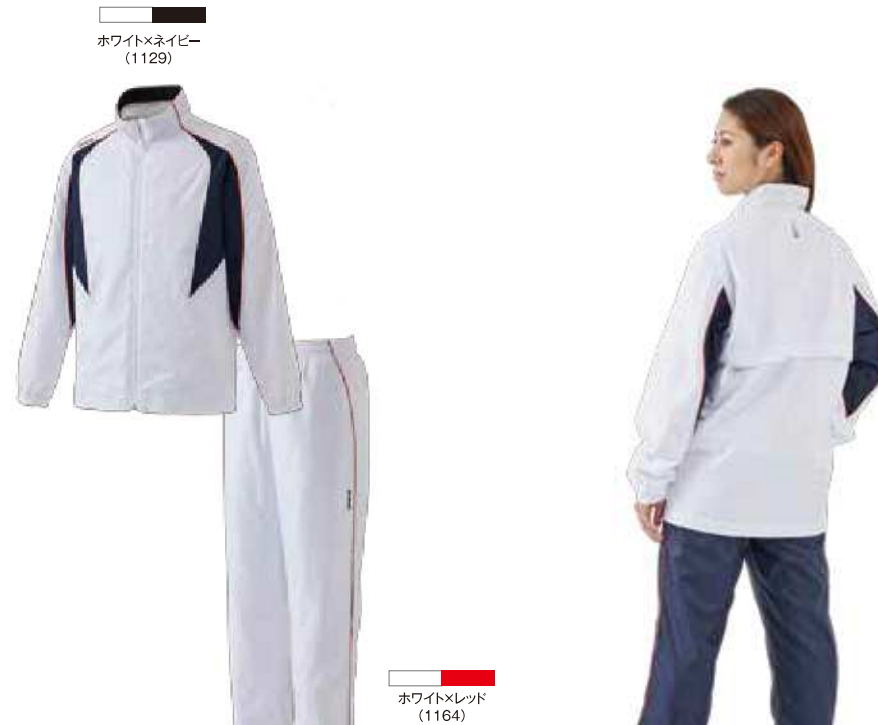
ホワイト×ネイビー (1129)